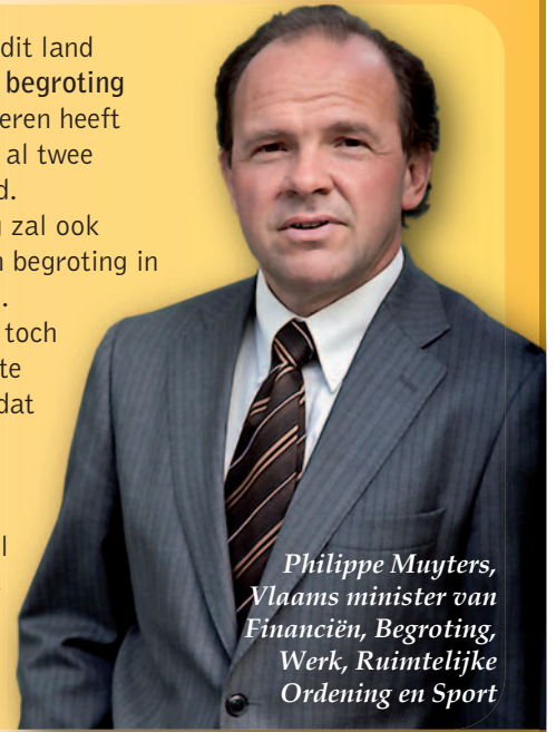
Philippe Muylers, Vlaams minister van Financiën, Begroting, Werk, Ruimtelijke Ordening en Sport

Als enige overheid in dit land heeft Vlaanderen een begroting in evenwicht. Vlaanderen heeft de voorbije twee jaar al twee miljard euro bespaard. De Vlaamse Regering zal ook de volgende jaren een begroting in evenwicht voorleggen. Als er geleidelijk aan toch wat budgettaire ruimte komt, investeren we dat zoals Europa vraagt: in onze economie (O&O, infrastructuur, werk ...) en in sociaal beleid (kinderopvang, wachtlijsten gehandicapten, kindpremie ...).