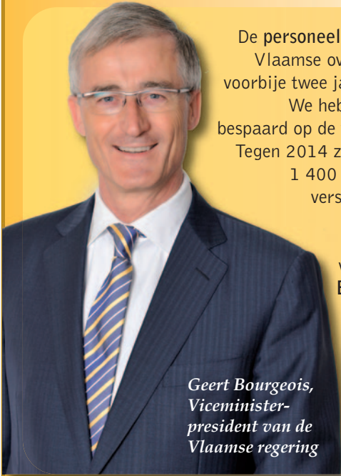
Geert Bourgeois, Viceminister- president van de Vlaamse regering

De personeelsbudgetten van de Vlaamse overheid daalden de voorbije twee jaar met 5 procent. We hebben ook drastisch bespaard op de werkingsmiddelen. Tegen 2014 zullen er bovendien 1 400 ambtenaren op de verschillende Vlaamse departementen niet stelselmatig vervangen worden. Een besparing van 50 miljoen euro per jaar!