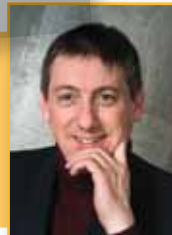
Jan Jambon Kamerlid