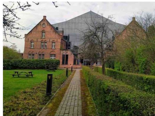
Het Paterspand met de kloostertuin, die deels openbaar wordt.

ontwerp. “Die architecten zijn vol van Turnhout”, lacht Kris Sobry. “Zij waken over een ontwerp dat zich spiegelt aan het historische klooster en de kerk, die we uiteraard behouden. Het uitzicht en de